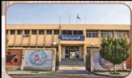
كلية التربية الرياضية

وما زالت هناك لوائح كليتين فقط في الجامعة هما التجارة والحقوق تتطلب التجديد والتحديث . . . وجرى قيام إدارة الكليتين بتحديث لوائحها حسب نظام الساعات المعتمدة.