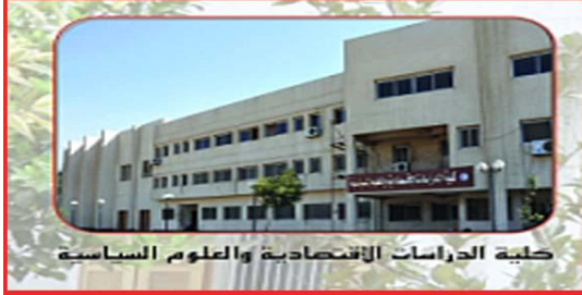
كلية الدراسات الاقتصادية والعلوم السياسية