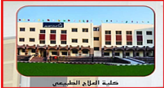
كلية العلاج الطبيعي

B . كليات كانت فريدة في مصر وكانت موجودة لدى جامعة القاهرة فقط